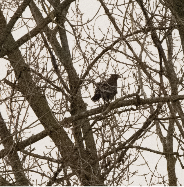
Bastaardarend tussen

De bastaardarend is een compacte donkere arend met een vleugelspanwijdte tussen 1,5 en 1,8 meter. Bij jonge vogels vallen vooral de witte vlekken op de rug en vleugels op. De determinatie van deze soort is niet zo eenvoudig want de verwante schreeuwarend lijkt sprekend op de bastaardarend. De Engelstalige benaming van beide soorten illustreert dit mooi: greater spotted eagle (bastaardarend) en lesser spotted eagle (schreeuwarend). Dat beide soorten het blijkbaar ook moeilijk vinden om elkaar te onderscheiden zijn de hybriden of kruisingen tussen de beide