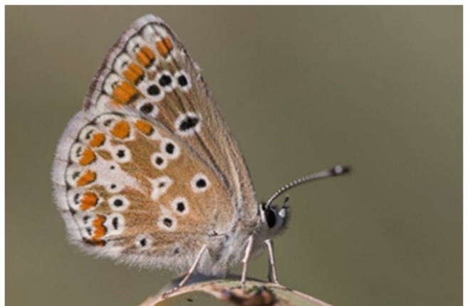
Foto's: Hazenpootje (Ilse en Marc) Bruin blauwtje (Maxime Fajgenblat)