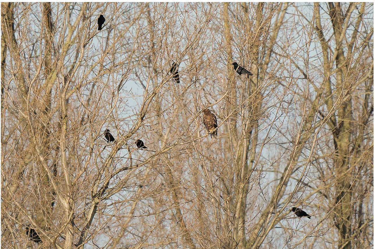
Bastaardarend tussen de kraaien

Het exemplaar in de Moervaartvallei is één van de weinige pleisterende vogels, wat deze waarnemingen nog unieker maakt. Het verspreidingsgebied in Europa loopt van de regio Kaliningrad aan de Oostzee, over Noordoost Polen, de Baltische staten, Wit-Rusland, Rusland, Oekraïne, Moldavië en Roemenië.